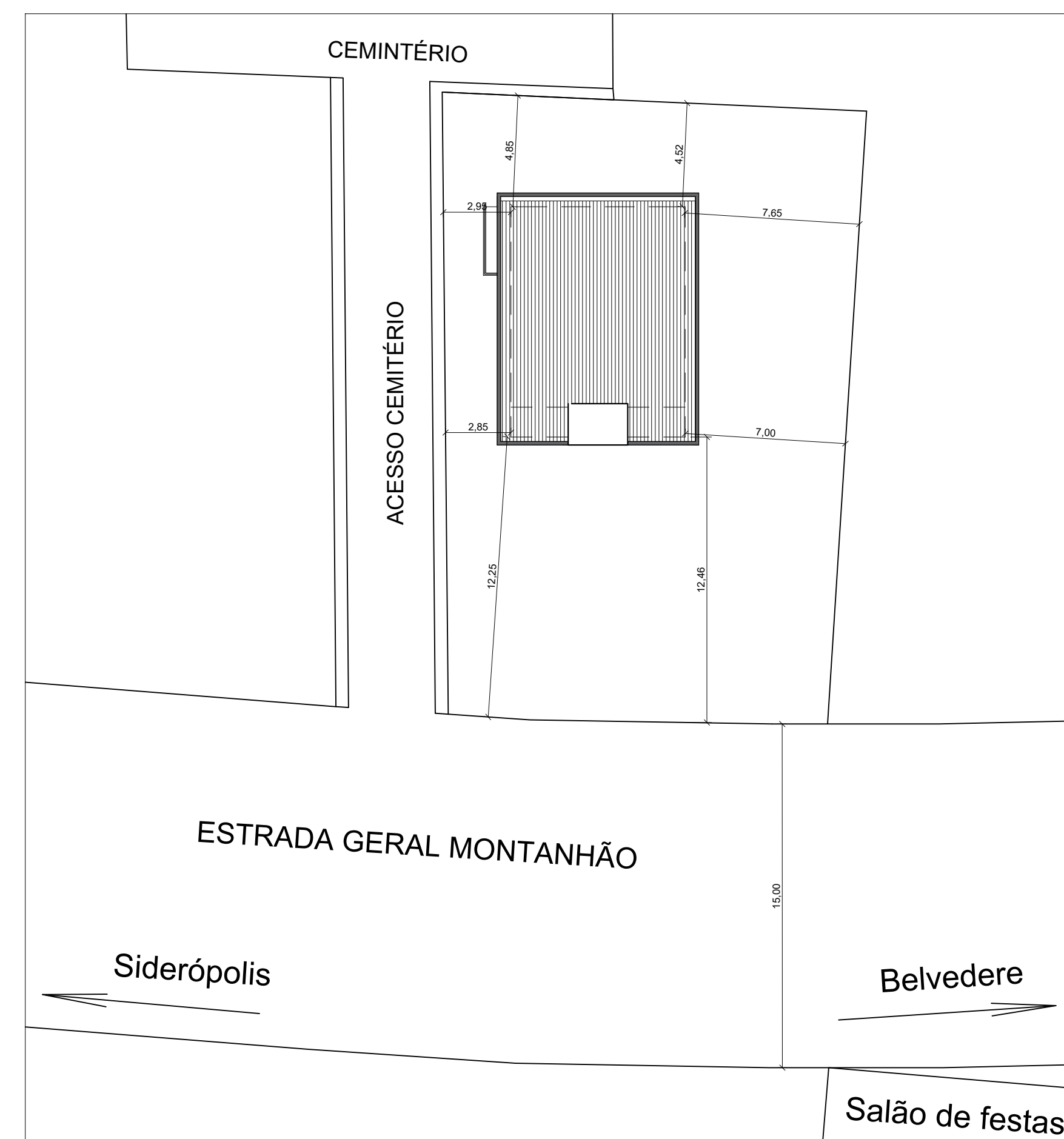
PLANTA DE LOCAÇÃO ESC: 1:200